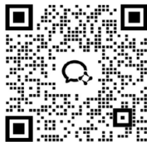
遵义会议会址一日游二维码，请扫码加入群组