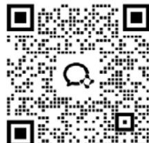
贵阳市内一日游二维码，请扫码加入群组