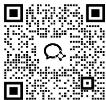
黄果树大瀑布一日游二维码，请扫码加入群组