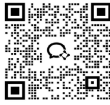
中国天眼一日游二维码，请扫码加入群组